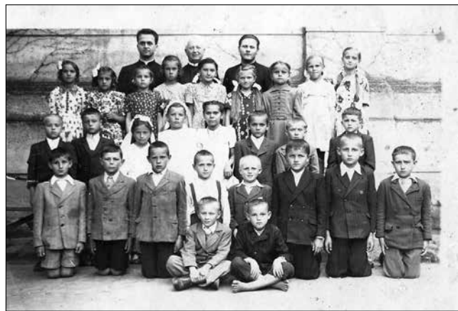
9. kép – Elsőáldozók 1951-ből

Bár 1949. nyarán megszüntették az iskolai hittant, a hittanoktatásra ekkor még 863-an jelentkeztek. Árnas Gyula plébános ekkor már