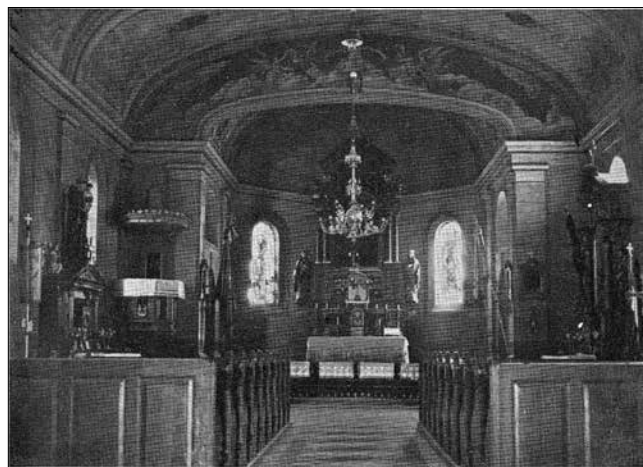
4. kép – Korabeli képeslap a templom belsejéről

A felszabadult területekért 1920. szeptember 18-án tartottak hálaadó szentmisét, ahol jelen volt Szeged szabad királyi város polgármestere, a városi kapitány és a főügyész is. A jeles személyiségek látogatása után, október 27-én a polgármester úgy határozott, hogy a templom udvarán felhalmozott anyagokból a plébánia épületét ki kell bővíteni. November 7-én megkezdték az építkezést, december 3-ra tető alá került az új épületrész. Az építkezést márciusban