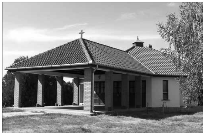
12. kép – A települési összefogással elkészült új ravatalozó épülete