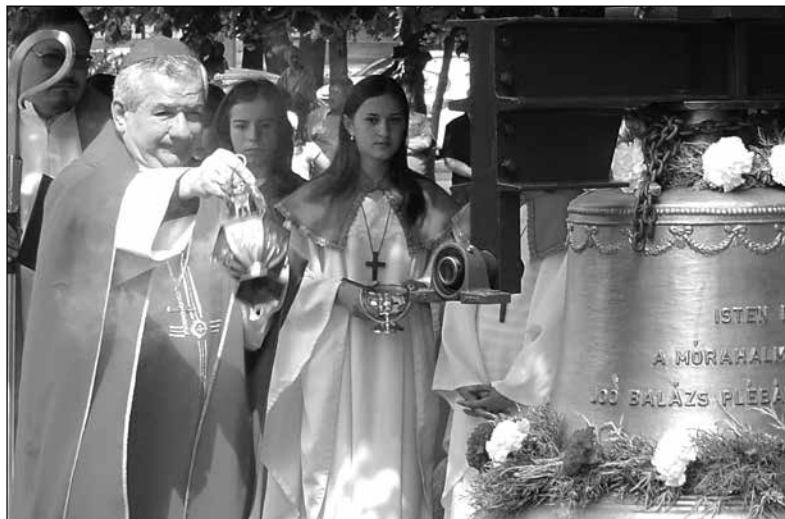
15. kép – Az új harangokat Dr. Kiss-Rigó László megyéspüspök szentelte fel.

2008. szeptemberében a Szeged-Szentmihály búcsúi szentmiséjén ünnepélyes keretek között adták át egyházközségünknek az ottani plébánia padlásán talált régi lobogót (a rajta lévő szalagokkal), mely