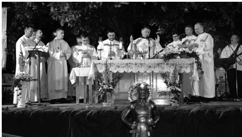
19. kép – Az ünnepi szentmisét a térség papjai közösen mutatják be a szabadtéri oltárnál. A kép előterében a búcsú alkalmából a templomnak ajándékozott Szent István- szobor.

A szentmisét követő fáklyás körmenet a belvároson keresztül az Aranyszöm Rendezvényház udvarába vezet, ahol a város vacsorával látja vendégül a zárandókokat.