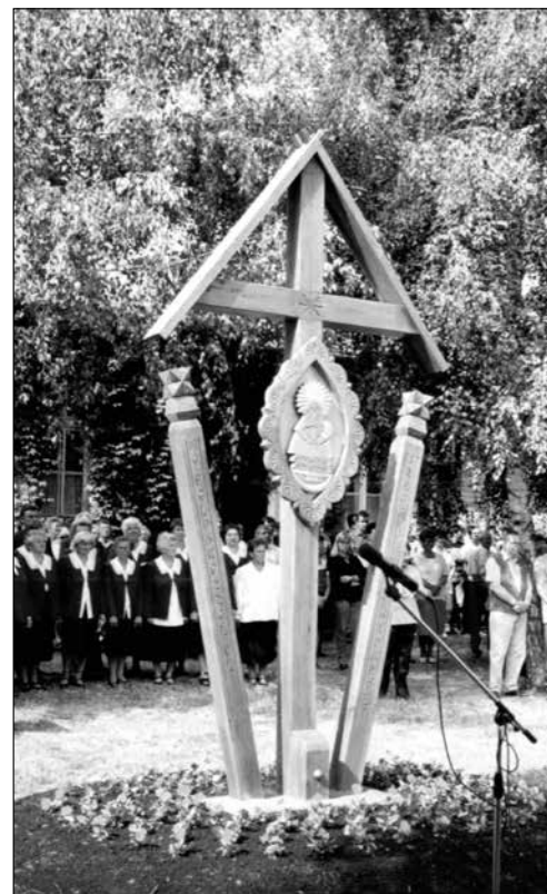
13. kép – A Röszei út mellett álló Máriás kereszt átadása 1999-ben.

2006-ban az 1956-os forradalom és szabadságharc 50. évfordulója alkalmából