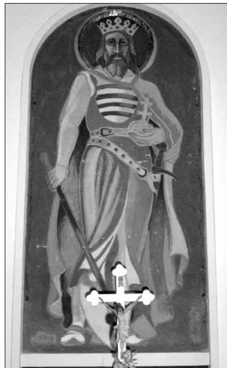
8. kép – Az 1948-ban elkészült Szent László kép, melyet az idők során többször – jelenleg is – eltakart az elé állított főoltár.

Alsóközpont abban az időben valódi központként működött vallási tekintetben is. Emiatt a templom gyakran kicsinek bizonyult, így akkoriban megérlelődött egy új templom építésének gondolata – olvasható a Historia Domus -ban. A történelem