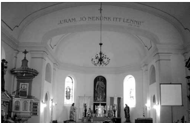
16. kép – A 2013-ban megújult templombelső

terület alatt (egészen a bejárati ajtóig) meleg vízzel fűtenek a téli időszakban. A járólapokat is kicserélték, a korábbi fekete-fehér minta helyett a falak sárgás színéhez illeszkedő burkolólapok kerültek a padlóra. A padláson talált régi csillárdarabot mintának használva készültek el az új, de korhű csillárok és a mindkét oldalon a falikarok. Leglátványosabb változásra a szentélyben került sor, ahol a felújítás óta egy időre ismét a falra festett 1948-as főoltárkép vált láthatóvá, mellé pedig végre megérkeztek a hosszú idő óta tervezett színes üvegablakok, melyekről Szent István és Szent Erzsébet alakja tekint le a látogatókra és a hívekre. (16. kép)