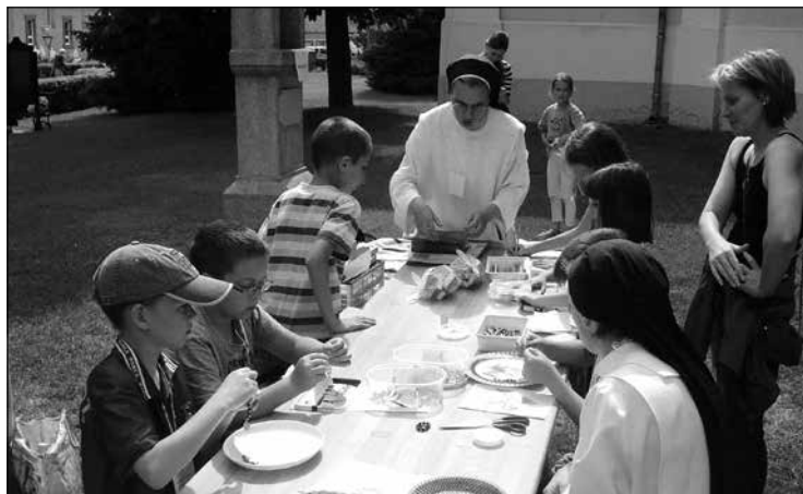
17. kép – A kézműves foglalkozások minden esztendőben sok érdeklődőt vonzanak, különösen így volt ez 2015-ben a szerzetesnővérek látogatásakor.

A szerzetesség évéhez kapcsolódó 2015-ös alkalom attól vált különlegessé, hogy elfogadták plébániánk meghívását a domonkos nővérek Hódmezővásárhelyről (17. kép), az újszegedi Salvator nővérek és a Jézus Szíve Társaság nővérei, illetve a Szeged-Felsővárosi plébánián szolgáló minorita atya és cserkész segítői is, így a családi nap résztvevői személyesen találkozhattak megszentelt életet élő férfiakkal és nőekkel. 2016-ban az Irgalmasság évéhez kapcsolódó játékos feladatokon és komolyabb beszélgetéseken keresztül